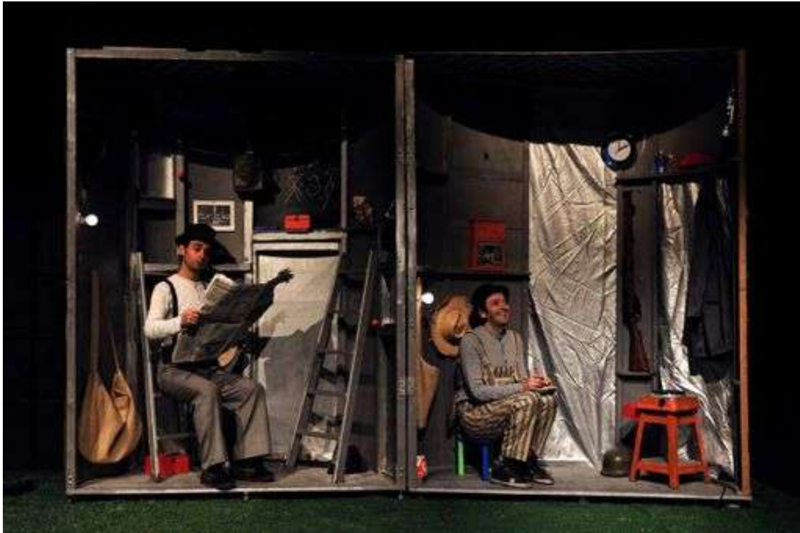
-Año 2.009 "MARÍA ESTUARDO (RAZÓN DE ESTADO)" de Friedrich Schiller Coproducción Tranvía Teatro (Zaragoza), La Fundación (Sevilla) Dirección: Pedro Álvarez-Ossorio Fecha de estreno:15-agosto-2.009. XX% Festival Castillo de Niebla.(Huelva)