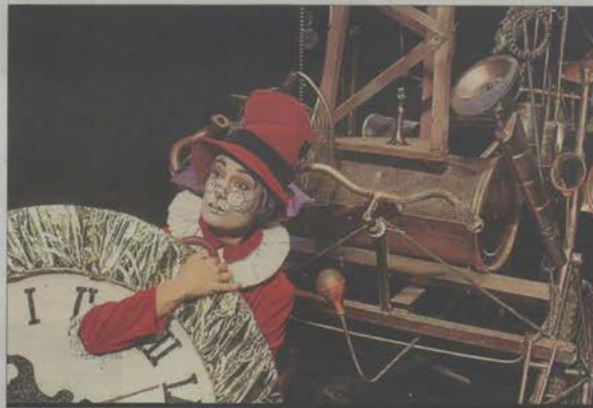
Un momento de la representación de 'Alicia'.

Unas 350 propuestas de compañías andaluzas, nacionales e internacionales se han recibido en Palma, Feria de Teatro en el Sur. Finalmente, durante cuatro intensos días el telón se levanta a una programación de 27 obras seleccionadas desde la