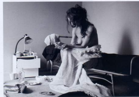
Not never on time de Khea Ziater

Salto es la nueva propuesta escénica de Metrokoadroka creada junto con J.B. Pe-