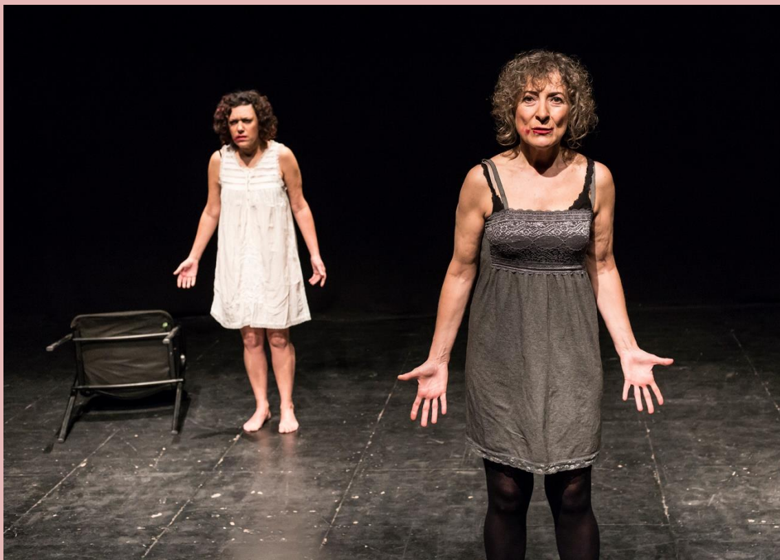
Foto de ensayo

Y todo ello bajo la premisa de la continuidad.