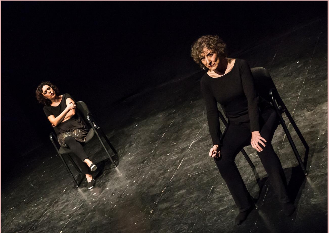
Foto de ensayo