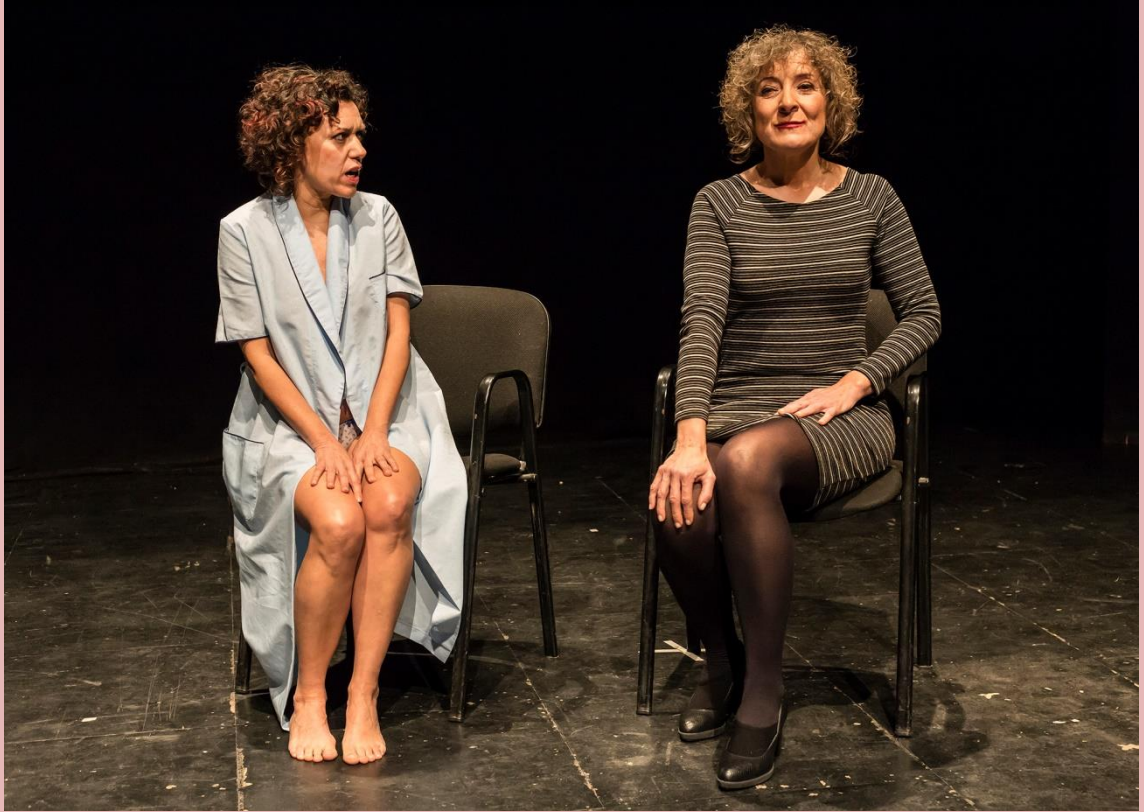
Foto de ensayo

Al fin y al cabo se trata de eso: de vivir siendo ellas mismas, más allá de etiquetas, simplemente queriendo ser personas.