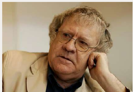
Sueño Lorca o el sueño de las manzanas es la obra más conmovedora sobre el poeta granadino que he visto en muchos años. IAN GIBSON (Biógrafo de Lorca)

Tras casi 20 años de compañía y el bagaje de nueve montajes, Baraka Teatro decide que la mejor manera de celebrar su trabajo y el centenario es retomando el montaje que les estrenó como compañía.