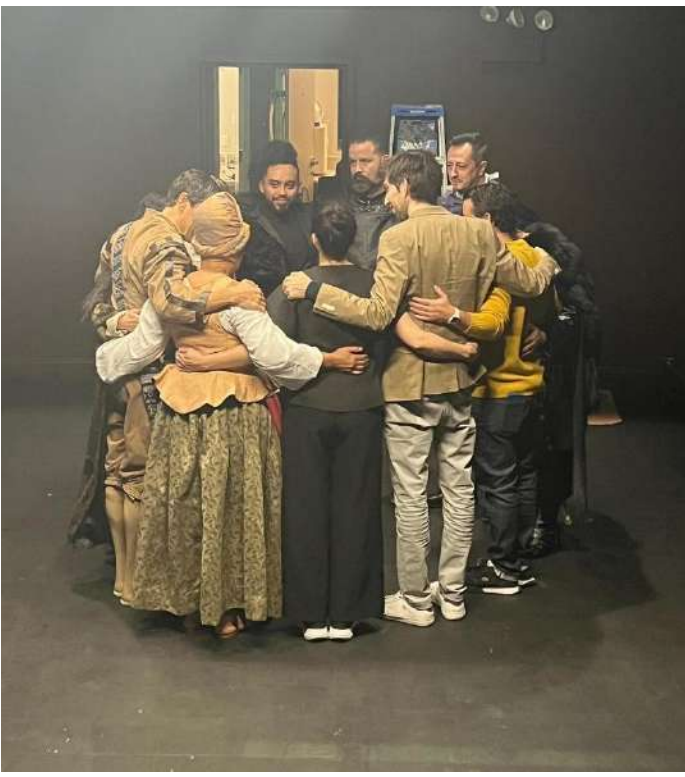
El círculo con el equipo, director y elenco antes de una función en Teatro Círculo de Nueva York