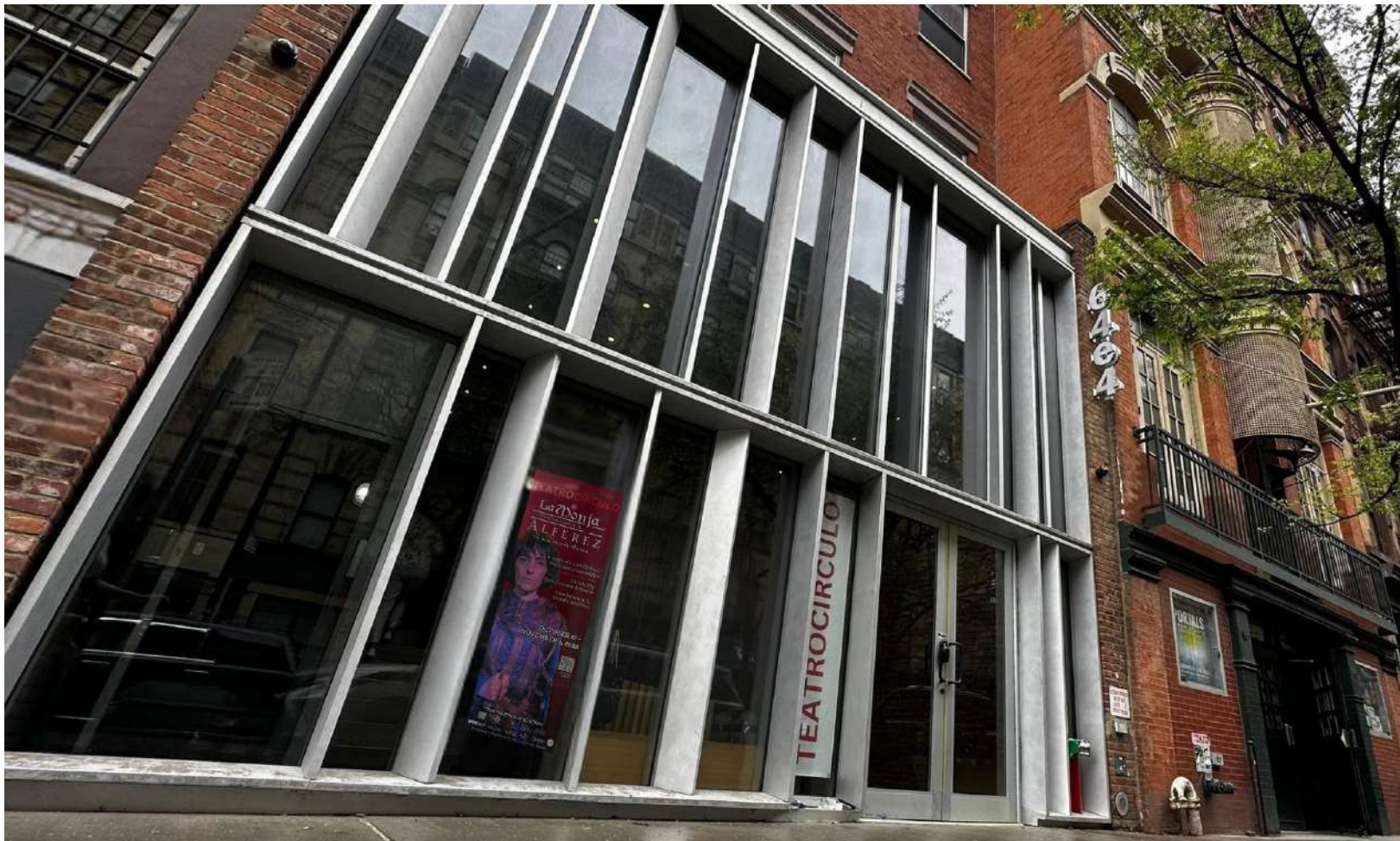
El edificio de Teatro Círculo en Manhattan en la Ciudad de Nueva York, 64 East 4th Street